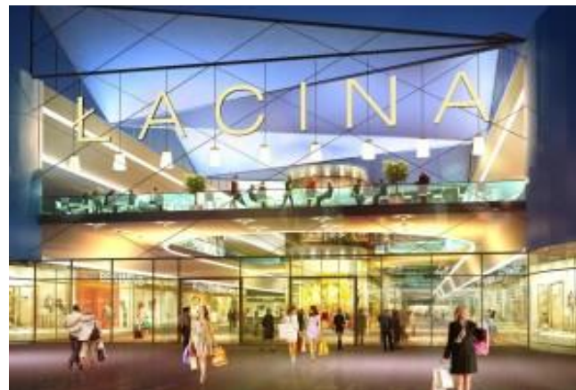
CH ŁACINA 90 000 mkw.