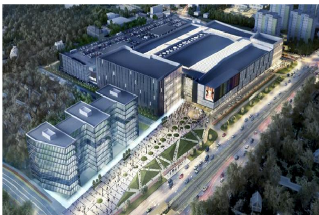
METROPOLIS 73 300 mkw.