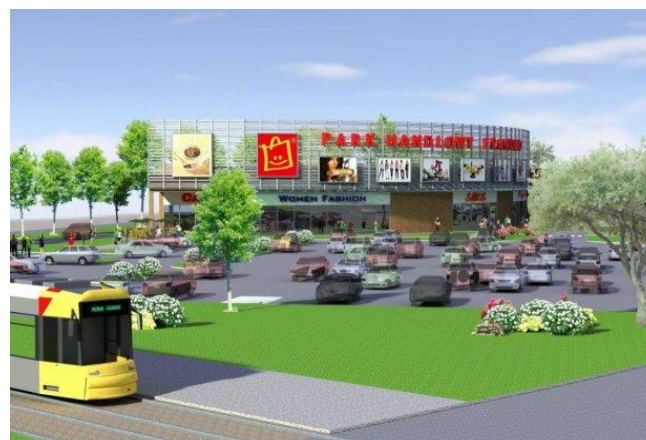
PARK HANDLOWY FRANOWO 14 000 mkw.