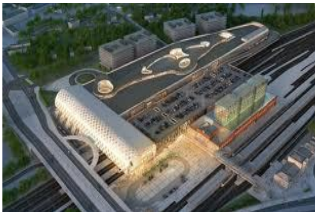
POZNAŃ CITY CENTER 60 000 mkw.